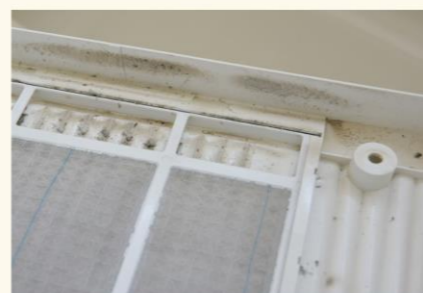
▲カバーにはカビが、かなりついてました。※カバーを開けることは、メーカー推奨外でした。