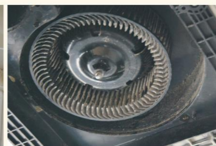
▲中のフィルターにもかなりのホコリがありましたので、掃除機で吸いながらホコリを落としました。