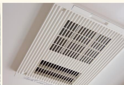
▲なんとか、外見だけはきれいになりましたので、1年後に点検と清掃を依頼しようと思います。