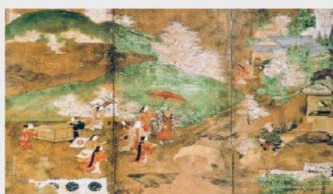
『醍醐花見図屏風』(部分) 桃山時代

奈良時代、貴族の間では、梅を鑑賞する花見の習慣がありました。平安時代、日本独自の国風文化が盛んになるとともに、花見で鑑賞する花は徐々に桜へ変わっていきました。