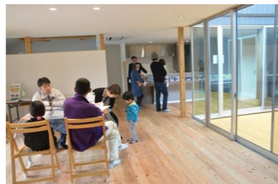
広々としたリビングで、好評でした。