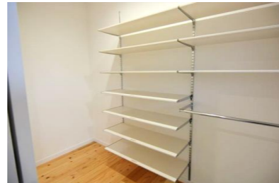
玄関横のシューズクローゼット。