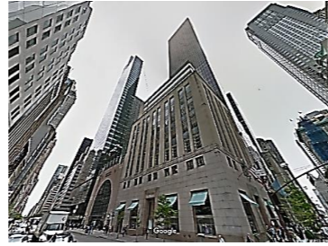
ティファニービルの後ろにそびえ立つトランプ・タワー

日本でも赤レンガ造の「東京駅」の修復工事500億円の捻出のために低層の東京駅の使っていない空中部分の容積率を周辺の高層ビルに譲渡することによって捻出しました。これにより「新丸ビル」「東京ビル」は階層を引き上げることができたそうです。空中権は100年ほど前にアメリカで考案されたもので、空中権を売買する仲介銀行もあるということです。ちなみに先ほどのトランプ・タワーの空中権の取引価格は37年前に10億4500万円だったそうです。(営業 堤)