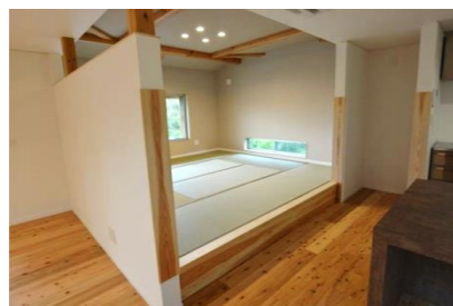
小上がりの茶の間。