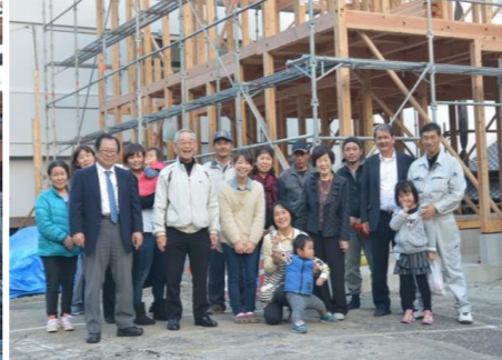
餅撒きの様子(左)とご家族スタッフみんなの集合写真(右)。竣工まで頑張ります!!