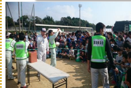
お楽しみ抽選会。今年も豪華景品でした。