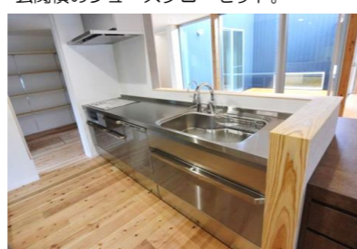
自動洗浄の換気扇など、びっくりされていました。