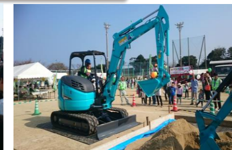
今年も子供たちに1番人気だった重機の操縦体験。

11月6日に毎年恒例になった「土木の日」イベントが開催され、多くのお客様で賑わいました。