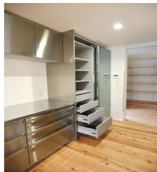
収納量抜群のキッチン収納。

■ たくさんの方にご来場いただき、自然素材をふんだんに使ったところなど、この家の良さを体感していただきました。