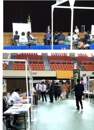
← 当日の様子 経営に役立つセミナーも開催されており(左)、有意義な時間を過ごすことができました。