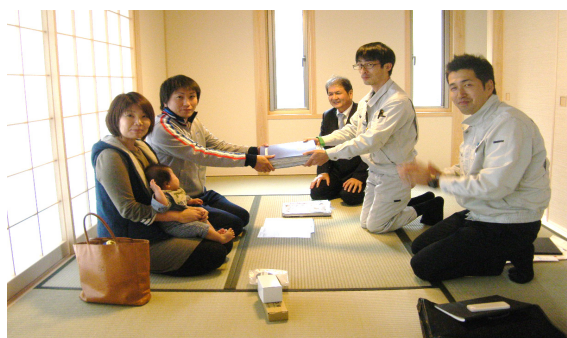
●見学会の後日、お施主様へのお引渡しを行いました。今後とも末永くよろしくお願いたします。