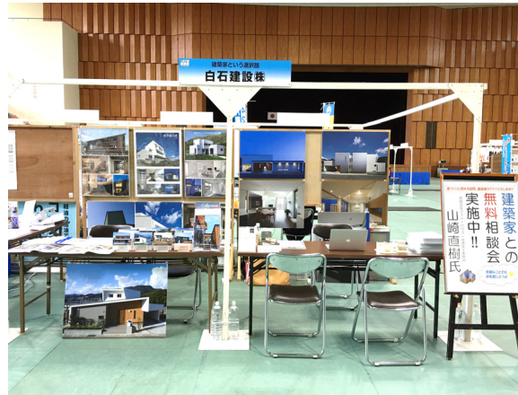
← 白石建設・ASJ佐世保スタジオ