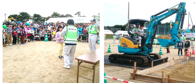
●今年も重機の体験コーナーと豪華賞品が当たる抽選会は、大変人気があり大盛況でした!