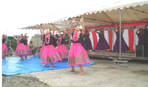
今年もオープニングを飾っていただいたフラダンスチームの皆様。