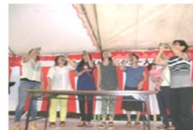
ラムネ早飲み競争！早い！！