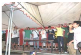
ビール早飲み競争！又ルイ！！