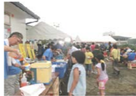
かき氷は子供達に大人気でした。カラオケ大会は熱唱の連続！！