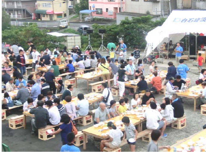
本年も延べ300人を超える皆さんにご参加いただきました。