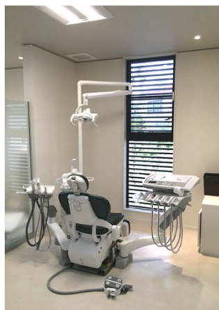
最新の診療ユニットが3台完備されています。