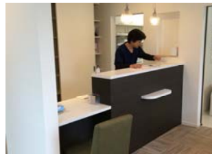
モダンな内装とインテリアの院内。

けいすけ歯科クリニック 〒859-5361 平戸市紐差町1021-17 TEL/FAX 0950-28-0519 HP http://keisuke-dc.com