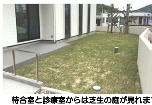
待合室と診療室からは芝生の庭が見えます。