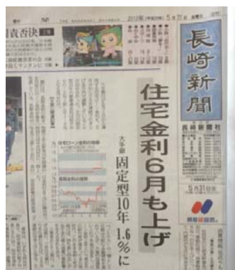
5月31日長崎新聞より

また来年4月には、現行の消費税率5%から8%にUPの可能性が大きいので、「住宅購入価格が上がり、更にそれを支払うローン金利＝月々の支払い額も上がる！！」と言うダブルパンチが襲うかもしれません！！